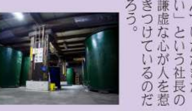
岩村醸造株式会社

に渡って引き継がれる「玲瓏馥郁（れいろうふくくい）」（透き通るよう輝き、良い香りが漂う）の酒造りは、こうして米と水の相性を大切にすることから生まれる。