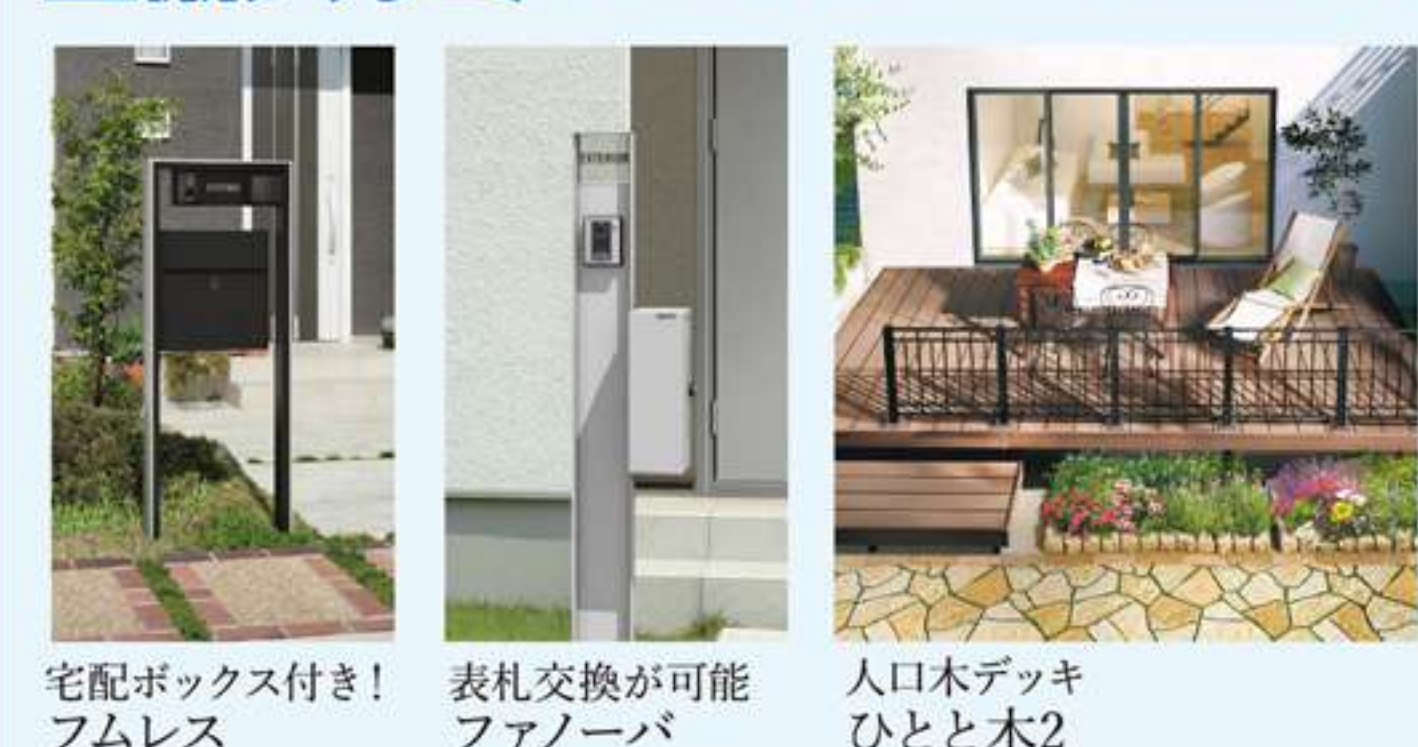
宅配ボックス付き! フムレス 表札交換が可能 ファンローバ 入口木デッキ ひとと木2