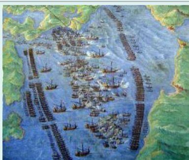
セルバンテスが活躍したレパントの海戦 (ギリシャ沖、1571年)

ここからは私の邪推も入るが、晩年セルバンテスは開き直つたに違いない。激動のヨーロッパに翻弄され辛苦の連続だった人生も残り少ない。ならば、軽妙なユーモアと皮肉、滑稽さを入り交えて徹底的に笑い飛ばしてしまうに限る。こうした想いを表現したのが、この著となった。虎は死して皮を残し、セルバンテスは死して世界で最も読まれ続ける不朽の名作『ドン・キホーテ』を残した。あつ晴れ、セルバンテスである。