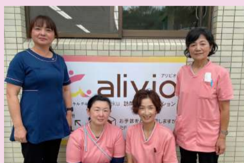
いつも笑顔で前向きな4人

現在、看護職3名、事務員1名で頑張っています。アリビオの持ち味は、スタッフ皆が前向きで、いつも笑顔で仕事をしていることです。大変なこと、悩むこと、落ち込むことがあっても、一人で抱えることがないように、些細なことでも話し、最後は笑ってリセット！団結力はどこにも負けません。