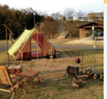
オートキャンプ場

また、施設内の売店には地元の農家が朝採りした季節の野菜をはじめ地元産のハム・ソーセージやこんにゃくが並ぶ。勿論、キャンプをしなくても温泉やレストランで穏やかな時間を過ごせる。自然が醸し出す恵那の魅力満喫あれ。