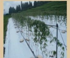
恵那市三郷町野井地内

しかし、当農園の目指すところは、「6次化」の先にあります。無事その認定を受けられた後は、第4次産業革命と称される発想力やコアイネーション力、文化力と言ったソフトパワーを結合させた「第10次産業化」に向けた新たなビジネスモデルを構築してゆく所存です。今後、中山道じねんじよ農園では、地域の様々な産業との「新結合」などによる活性化を図り、まちと考えています。何とぞ、ご指導ご鞭撻を賜らんことをお願い申し上げます。