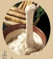
表題が 前号まで の「じね んじよだ より」から

「中山道じねんじよ農園だより」に変わってこのお気づきでしょうか?この度、当事業の名称を「中山道じねんじよ農園」とすることに決定しました。