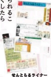
せんとらるライナー 第1号