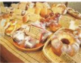
様々な種類のパンが店頭に並び

お店は珍しいそう。夫婦二人で1カ月半かけて手作業でこしらえたと言う愛着のある窯で、多い時には一日500個のパンが焼き上がる。そして、もう一つのこだわりは、イースト菌を使わず