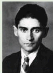
フランツ・カフカ