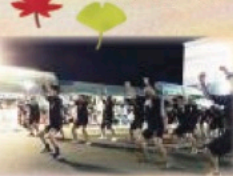
HAKAを披露する若手社員

今年も、みのじのみのり祭のお神輿競演に参加致しました。多くの皆様からご声援、ご厚志を賜り御にあげ、ご厚志を賜りました。お陰様で晴天に恵まれた秋の夜を十分に楽しむことが出来ました。 また、今年も審査員席前のパフォーマンス時間間にラッパのウォールドカップでおなじみとなった「ハカ」を取り入れました。こちらも大変好評だったと聞き、喜んでおります。来年以降も、もっと盛りを上げたハカを披露したいと思っております。