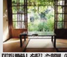
『仰臥漫録』を記した部屋(復元)

子規は、幕末の慶応三年、伊予松山に生まれた。五歳の時に父が他界。経済的には、後に外交官から国会議員となる母方の叔父の世話になり育った。中学に進むと自由民権運動の影響を受け政治家を志すようになる。その目的を為すにはどうしても東京に出