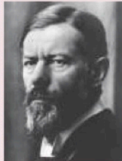
知の巨人 マックス・ウェーバー

と、この講演が行われた時代背景を知っておけば、それだけで私は思う。但し、それと数行で終わってしまふ。よって、この著に登場する「二つの政治家」を今日の我が国に当てはめて、私見を述べることとする。 1918年11月、ドイツ帝国は第一次世界大戦に敗北した。この敗戦によって社会秩序は乱れ暴動が相次ぎ、ついには革命によって帝政は崩壊した。この混乱期、学生たちは国家の行く末を案じ政治に熱狂した。1919年1月、ミュンヘン大学の学生同盟は、知の巨人と崇められるマックス・ウェーバーを招き入れ講演会を開催することに成功する。そのテーマが「職