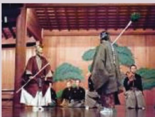
世阿弥の代表演目「高砂」の能舞台

この『花伝書』は、単に能楽者に能の奥義を伝えるだけのものではない。そんなものを遙かに超越したものがある。それは、彼が過酷な環境の中で生死をかけた勝負の世界に生きて芸術家であったことに加えて、並はずれた教養の持ち主であったことから来るものである。