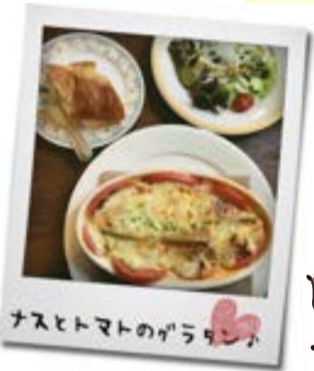
ナスとトマトのグラタン

大阪と神戸のレストランで修業を積んだフレンチシェフのご主人と、恵那市で唯一のJSA認定ソムリエの資格を持つ奥様が、地元野菜などを使用したこだわりの料理と、それに相性が抜群なワインを提供してくる。