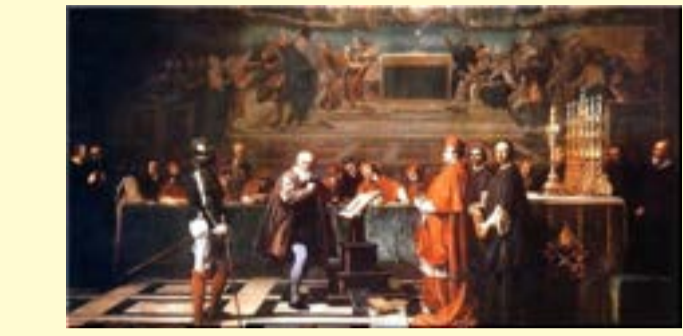
地動説を唱えたことにより宗教裁判にかけられるガリレオ

時は中世、ヨーロッパ。全ての価値観、判断基準の絶対的中心に神が位置していた。この時代、何人たりともキリスト教に異を唱えることは許されなかった。魔女狩り、異端審問は日常茶飯事。キリスト教が是としないコペルニクスの地動説を受け継いだガリレオは宗教裁判にかけられ終身刑に処された。