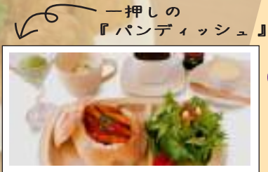
一押しの『パンディッシュ』

今回ご紹介するお店は、ベージュ&ガレットカフェ「Pand」さんです。平成22年11月にオープン。ランチメニューには、日替わりランチをはじめ、パスタランチやベグルランチなどがあります。なかでも一押しなのは「パンディッシュランチ」!