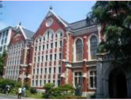
慶應義塾大学図書館旧館(重要文化財)