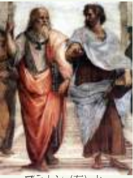
プラトーン(左)とアリストテレス(右)

この三人と言え「無知の知」「イデア論」「カテゴリー論」など等だそう。しかし、そんなものは凡人の私が理解できる訳もない。読む気にもならない。だが、今回のものだったら簡単に読める。立派な哲学書だと言うが、これのどこが哲学書かと思うほど一般的なものだ。そして、何より面白い。2500年に渡って読まれて来たものは、この先も未来永劫に読まれ続けるに違いない。しかも世界中で、一度お読みになられては如何だろうか。