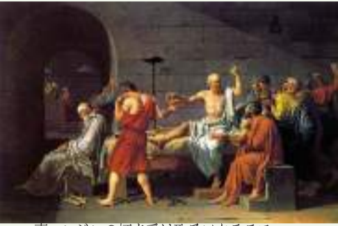
毒ニンジンの杯を受け取るソクラテス ルイ・ダヴィッド画『ソクラテスの死』より