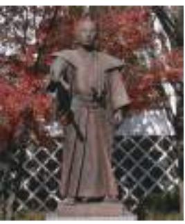
恩田木工民親公の銅像

「日暮硯」とは、江戸中期に信州松代藩十萬石真田家で行われた藩政改革を記した書である。このタイトルどこかで聞いた覚えがある。そう。「つれづれなるままに、日暮しすずりにむかひて…」ではじまる『徒然草』からとったものだ。吉田兼好が「暇つぶしにでも書いてみるか」と『徒然草』を上梓したときの心境を著者である馬場正方（諸説あり）が引用したものである。この『日暮硯』は、あの二宮尊徳が座右の書としていたことで一躍世に出た。また、もう一人。米沢藩の改革で著名な上杉鷹山もこの書を参考にした節が見られる。