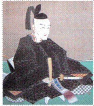
真田幸弘像（長野市松代町・長国寺所蔵）