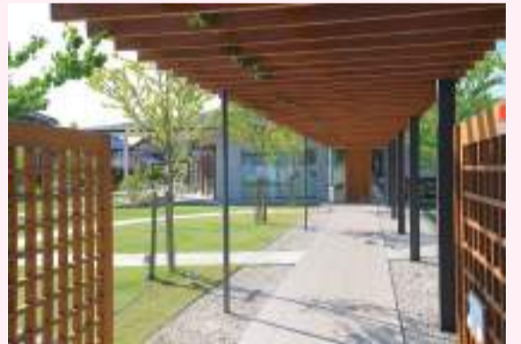
異空間へのエントランス