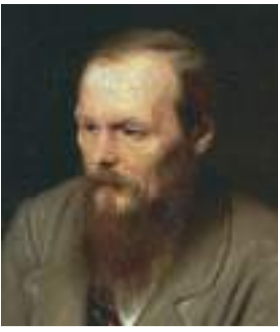
ドストエフスキー

さてドストエフスキー。彼はいわゆる「狂人」であった。彼をそうさせたのは尋常でない「父」と、余りにも過酷な「体験」であっ