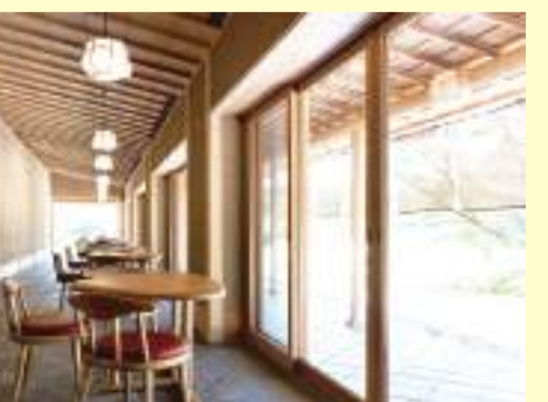
自然の名画が一望できる喫茶スペース