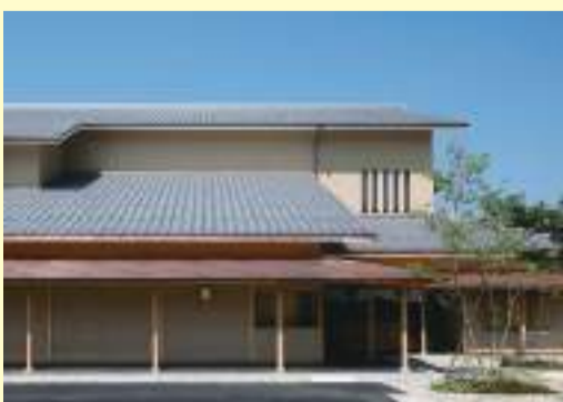
伝統的な数寄屋造りの建物と日本庭園

細部にも目を凝らして欲しい。その繊細さは恵那寿やの和菓子づくりに対する丁寧な心配りとも決して無関係ではない。そして、建物の一角には店舗とシックな雰囲気のある喫茶室が併設されている。喫茶室には重厚な栗の木製のテーブルと椅子がゆったりと窓際に並び、その窓を隔ててつづく庭は「笠置山の麓に広がる石山がこの庭までつづいている」ことを表現している。春夏秋冬が描く自然の名画を眺めながら甘味を口にすると時は正に至高の贅沢と云えよう。