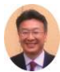
未曾 有の東 日本大 震災と 原発事

故。「明けましておめでとうございませう」と言っている。佳いものか挨拶の表現に悩む年の初めです。改めて被災された方々に心よりお見舞い申し上げます。そうした大変な一年ではありましたが、皆様方には格別なるご高配を賜りましたこと厚く御礼申し上げます。 さて、年頭にあたり我々の企業活動の基本となる考え方を説明させていただきます。企業が存続し繁栄し成長してゆくためには、