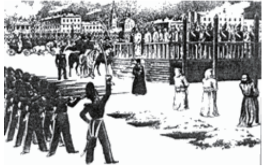
死刑執行を待つドストエフスキー等21名