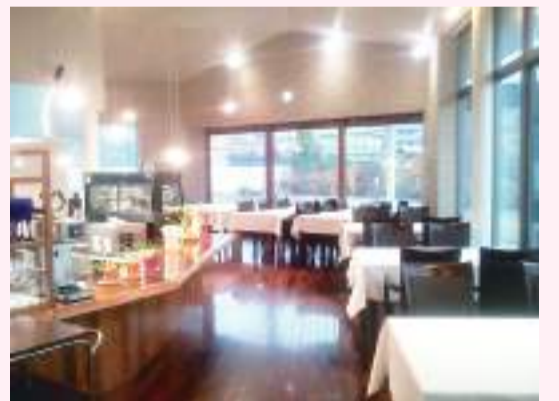
重厚感と清潔感あふれる店内