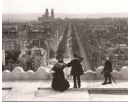
荷風が『散歩』した凡そ百年前のパリ