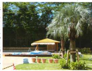
南国を感じさせるドリンクバー

今回の改修では、プール全体を丸ごとカリブの雰囲気というところがテーマ。頭上から大きな海賊が見下ろす入場門をくぐると、真っ先に目に飛び込んでくるのは正面に鎮座する巨大な海賊船。