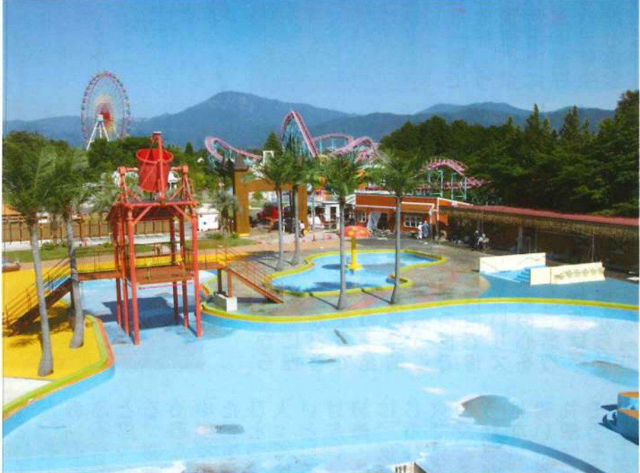
場内奥には巨大な海賊船が…

弊社がプールの改修工事を拝命したのが今年3月。それから4ヶ月余りの間、株式会社岡本製作所本社企業様のご指導のもと、プール本体ばかりではなく、併設される施設や建物、給排水や電気幹線などといったインフラなど全面的な点検・改修に努めて参りました。