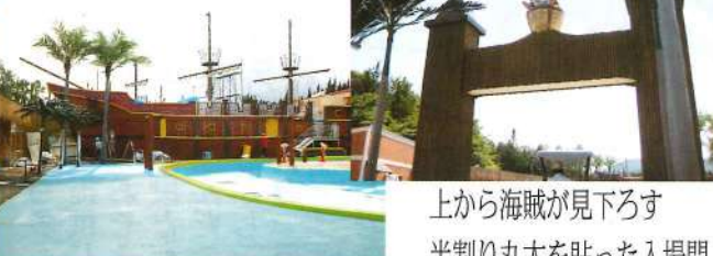
上から海賊が見下ろす半割り丸太を貼った入場門

今回の改修では、プール全体を丸ごとカリブの雰囲気というところがテーマ。頭上から大きな海賊が見下ろす入場門をくぐると、真っ先に目に飛び込んでくるのは正面に鎮座する巨大な海賊船。