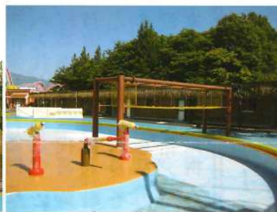
浮島に掛けられたうんてい

更に既存のウォーターコースライナーに加えて、アトラクションとして噴水や間欠泉、プール内に設けられた浮島やうんていなど、新しい遊具もめじろ押し。