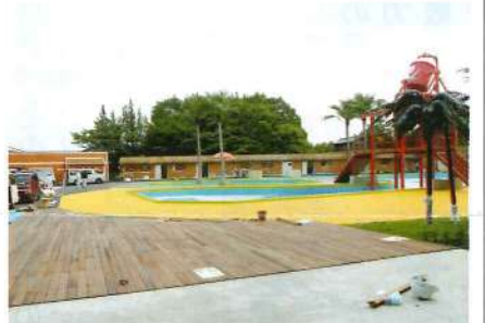
ウリン材を使用したウッドデッキとゴムチップ舗装

今回、施工させて頂いた恵那峡ワンダーランドの職員の方たちは、自分たちで出来ることは自分たちでやる、というスタンスで、シーズンオフには皆で遊具の補修やペンキ塗りなどの作業をしておられました。自らが手をいれることで、遊具や施設にも愛着がわき、来場者の皆様の笑顔がもつと、もって価値のあるものに見えると話してくださいました。