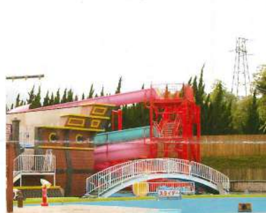
ウォーターライダーも塗装でお化粧直し

その他、来場者の視点に立った心配りも万全。今回新設されたショップには救護室の他に、小さいお子さま連れのお客様にも安心して利用できるよう授乳室も併設されています。