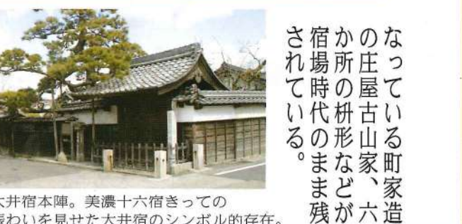
大井宿本陣。美濃十六宿きっての賑わいを見せた大井宿のシンボリック的存在。

明治初期には屋号を「旅館いち川」と改め、今日に至る。現在は、十四・十五・十六代目の三女将を守る。いち川には決して変えてはいけない老舗の本質と、絶えず新たなる変化を求め続けると云う不易流行がある。それは三人の女将の阿吽の呼吸が奏でるメロディと言えよう。