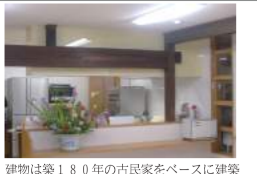
建物は築180年の古民家をベースに建築