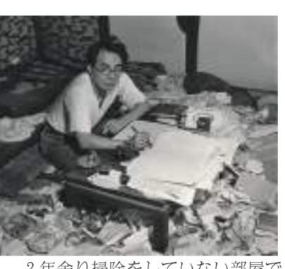
2年余り掃除をしていない部屋で執筆中の坂口安吾

発表。「人も日本も墮落せよ、墮ちるところまで墮ちよ」と挑発的なメッセージを発信し、時代の寵児となる。お座なり、卑怯、馴れ、欺瞞が許せず、剛合、伝統、束縛と云うものを嫌い、世相をぶった切る安吾は太宰治、織田作之助とともに無頼派の代表であった。無頼派は往々にして破滅型とも云える。安吾も当時はまだ許されていた覚醒剤ヒロポンを服用した。ヒロポンを飲むと寝られない。寝られないから大量の睡眠薬を大量の酒と一緒に飲む。そしてアル中にその