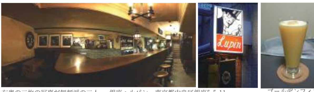
左奥の三枚の写真が無頼派の三人 銀座・ルパン 東京都中央区銀座5-5-11 ゴールデンフィズ

事を書いているが、実は私が坂口安吾を知ったのはこの店の写真からであった。今度、その奥のカウンターに座り、安吾の隣で、安吾が決まって頼んだと云うゴルドンフィズとやらを飲みながら、この墮落論をペラペラとやってみたいと思