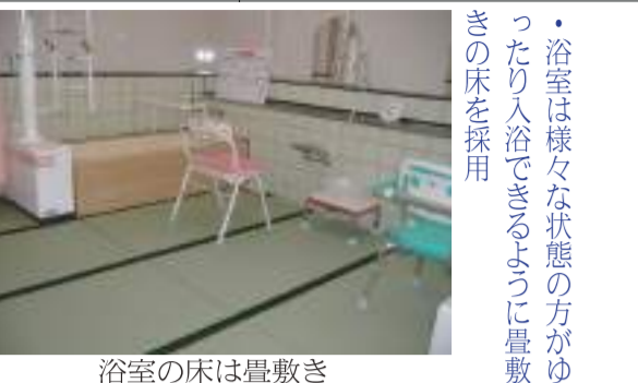
浴室の床は畳敷き