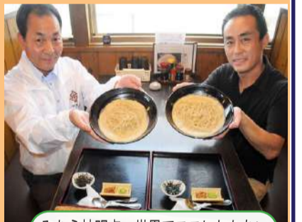
みむら神明点 世界でここにしかないであろう 自然薯スパゲティ

また、市内外の飲食店で弊社商品を使用した新メニュー開発も進んでいます。その第一号として豊富なパスタ料理で知られる、みむら神明店さんのメニューに「自然薯スパゲティ」を加えて頂きました。お陰様で好評を得ているようです。