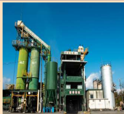
アスファルト合材プラント

昭和49年(1974)、恵那市武並町に開設された当センターは、アスファルト合材の製造販売、並びに建設廃材をリサイクルし販売しております。センター内には重油タンクなどが数多く存在すると共に、産業廃棄物の中間処理施設も併設しており、環境負荷が少なくありません。そのため、環境対策に万全を期し、平成13年(2001)には、環境マネジメントの国際規格ISO14001を取得。その後「E工場」(岐阜県環境配慮事業所)にも登録されました。いざ災害といった時に、間髪を入れずに地域住民の安全、