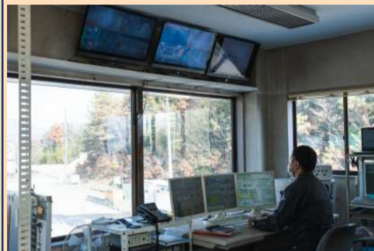
管理オペレーター遠隔操作風景

生命、財産を守るの我々建設に携わる者の責務です。当センターは、そうした役割を果たすためにも、極めて重要な施設です。今後とも、当センターの存在に磨きをかけ、「地域になくはならないセントラル建設」とならんがための努力を重ねてゆく所存であります。