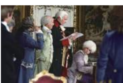
映画「アマデウス」より

この第二のボルヂノ当時の代表作。なるほど第一の時代点も随所にあがる。難解だが、その後モスクワに帰るが、モスクワの社交界や彼女に悩まされる日々が続く精神的におかしくなってしまう。35歳の秋にボルヂノへ静養に出かける。ここでまた書ける。これが『第二のボルヂノの秋』と言われる時期だが、この時の作品は狂いにかけていたためか意味不明なことが多く、『スペードの女王』はこの第二のボルヂノ当時の代表作。なるほど第一の時代点も随所にあがる。難解